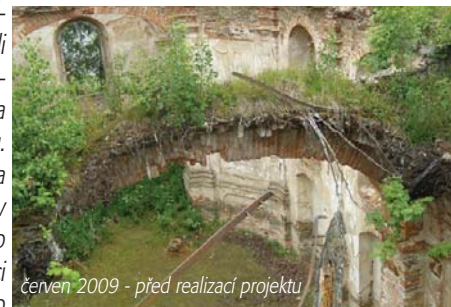
červen 2009 - před realizací projektu

doufáme, že bude i v termínu splacen. Celá akce stála 890.000,- Kč, kdy 89.000,- Kč bylo financováno ze zdrojů sdružení.