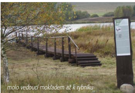
molo vedoucí mokřadem až k rybníku