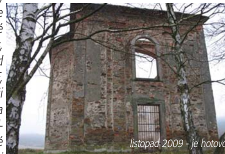
listopad 2009 - je hotovo