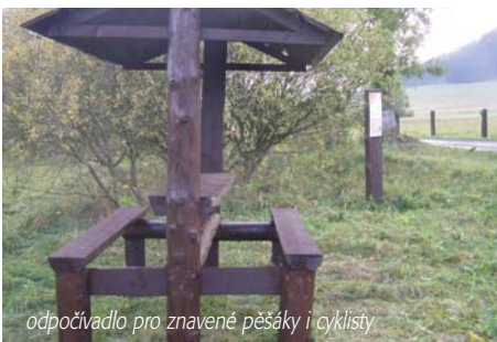
odpočívadlo pro znavené pěšáky i cyklisty

Krajský úřad Karlovarského kraje odbor životního prostředí přiznaná dotace: 50.000,- Kč