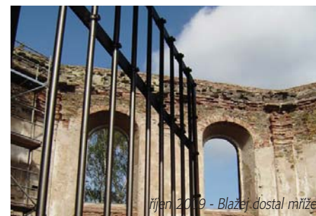
říjen 2009 - Blažeje dostal mříže