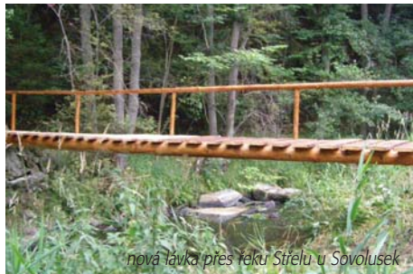
nová lávka přes řeku Střelu u Sovolusek

MAS VLADAR - Leader Ochrana a rozvoj kulturního dědictví žádost o podporu ve výši: .....650.000,- Kč