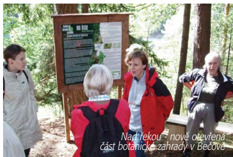
Nad řekou - nově otevřená část botanické zahrady v Bečově