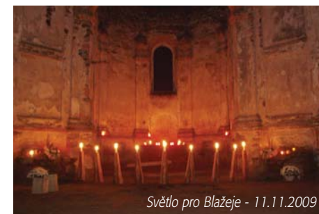
Světlo pro Blažeje - 11.11.2009