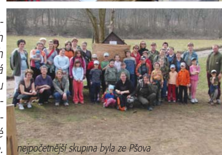
největší skupina byla ze Pšova