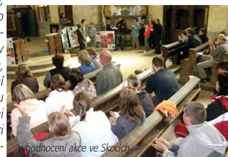
vyhodnocení akce ve Skocích